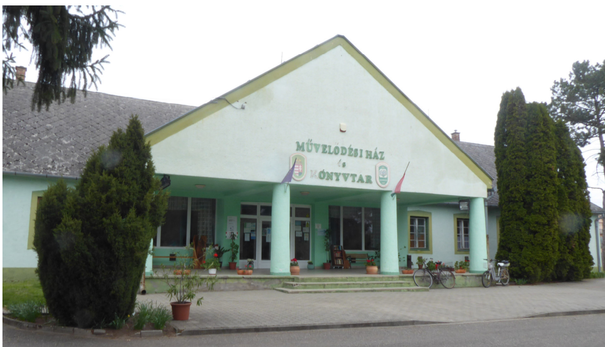
Épület képe (2021. április)

A hatályos településképi rendeletben előírt timpanon visszaépítése Az eredeti funkció (uradalmi intézői ház) változása és a megvalósított átépítések miatt anakronisztikus.