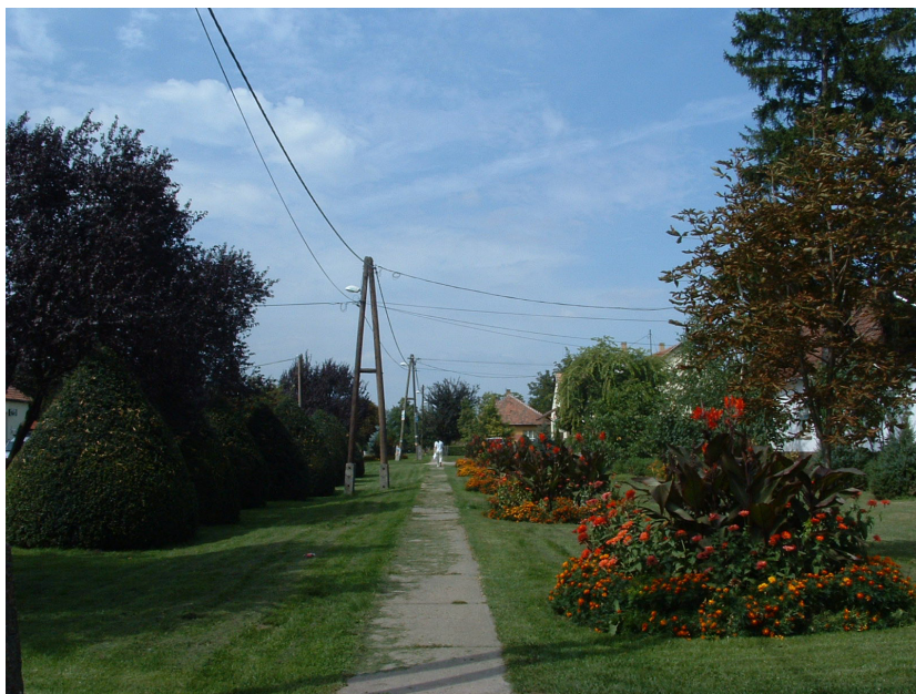
Tágas, virágos lakóterület