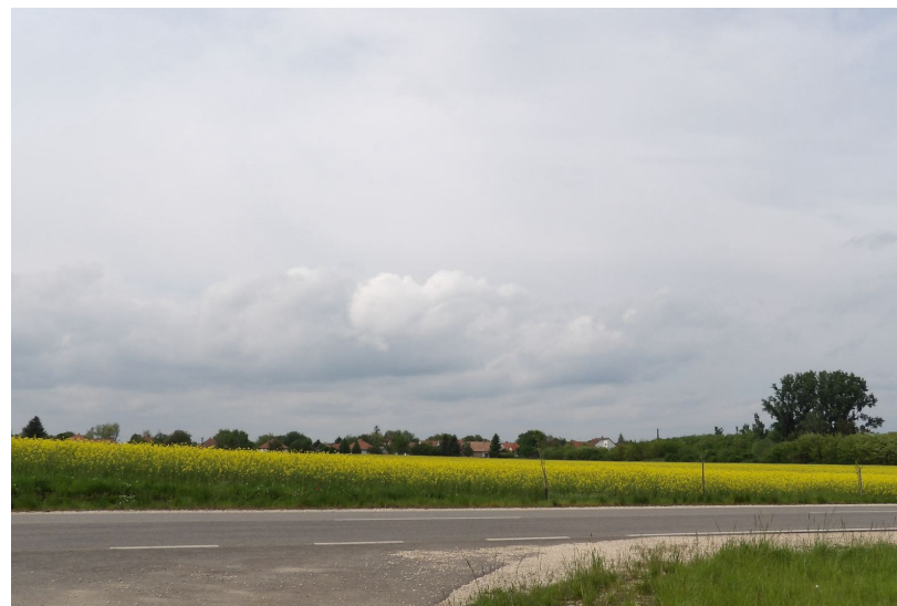
Így tűnik fel a sík tájban a belterület